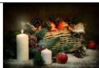
А) Новый год